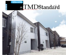
【前橋石倉モデルハウス】