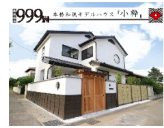
【高崎飯塚モデルハウス】 【太田モデルハウス】 【埼玉県本庄モデルハウス】