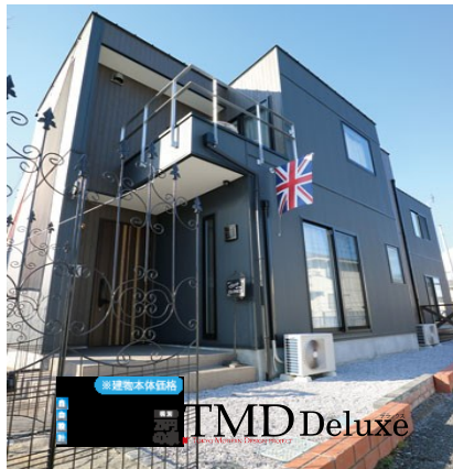
【高崎並榎モデルハウス】