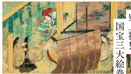
《源氏物語絵巻 第五十帖 東屋一 絵》現状模写