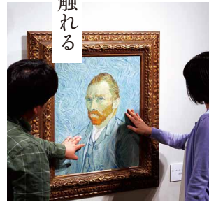
《フィンセント・ファン・ゴッホ「自画像」》再現