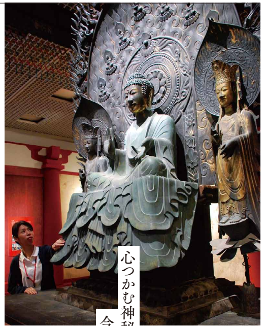
《法隆寺 釈迦三尊像》再現