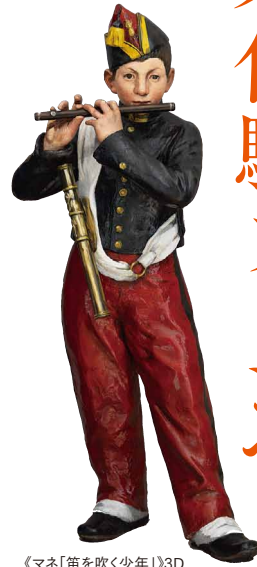
《マネ「笛を吹く少年」》3D